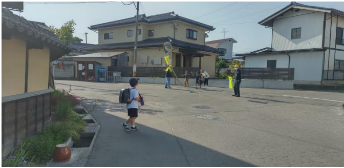
横断歩道が設置されていない道路

街頭指導では、交通安全協会、公民分館、民生児童委員、保健補導員、区役員が町内各所で通学中の児童生徒や高齢者をはじめとする歩行者の安全確保と、歩行者等の保護をはじめめとし、また安全運転への意識の向上を目的に活動を行いました。