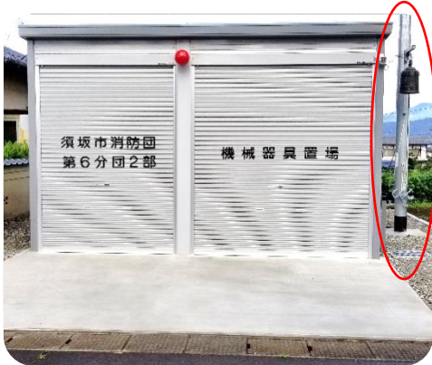
機械器具置場と隣接された 消防用ホース乾燥塔

須坂市消防団第六分団二部の機械器具置場及び、消防用ホース乾燥塔が熊野神社南側に新設されました。機械器具置場と消防用ホース乾燥塔が隣接されたことにより消防団活動の作業効率が向上しました。また、撤去された火の見櫓に設置されていた半鐘(小型の釣鐘)は消防用ホース乾燥塔に移設されました。