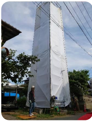
② 八月二日 午後

昭和三十二年九月、下田鉄工所により制作された火の見櫓が老朽化に伴い撤去されました。火の見櫓は火災の早期発見や町内への警鐘の発信を目的に使用されていましたが、近年は電話の普及や防災用無線等が整備され、その役目を終えました。