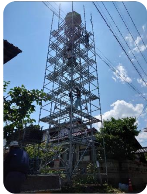
① 八月二日 午前