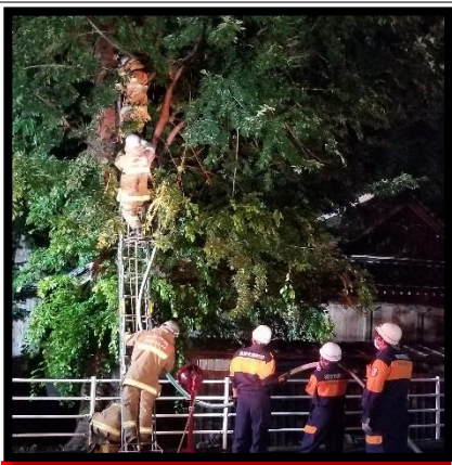
中間の空洞から上下に向かって放水

出火当時は幹の二カ所(木の中・下部)から火の粉や煙が出ていましたが約二時間後に鎮火しました。消防団は翌一五日(木)から一週間、警戒のため消防ポンプ付き積載車にて塩川区内を巡回しました。