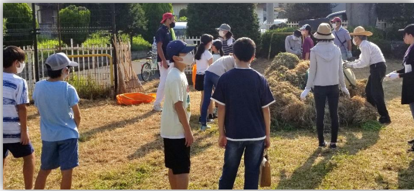
草刈機等で刈られた大量の草（長者公園）