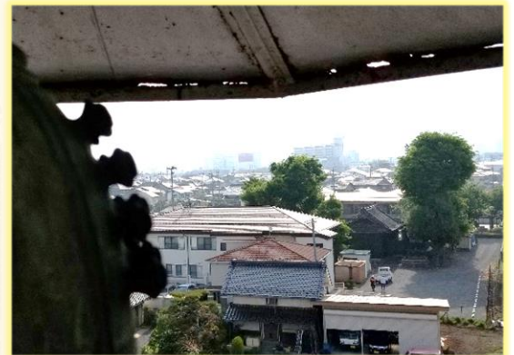
火の見櫓の最上段見張台から見た熊野神社と塩川町公会堂

また、半鐘（小型の釣鐘）を鳴らす際は、更に上の見張台まで登る必要があります。地上からの高さは約十五メートルで、五階建てビルの高さに相当します。何度も登ったことがある消防団員でも怖いとのことでした。