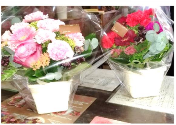
母の日のフラワーアレンジメント