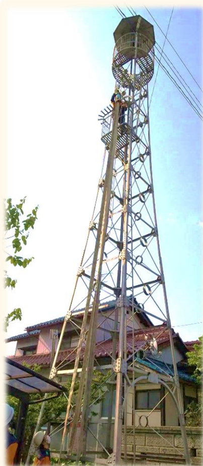
消防用ホースを乾燥させる消防団員

中間見張台は地上から約十メートルの高さに設置されており、三階建てビルの高さに相当します。