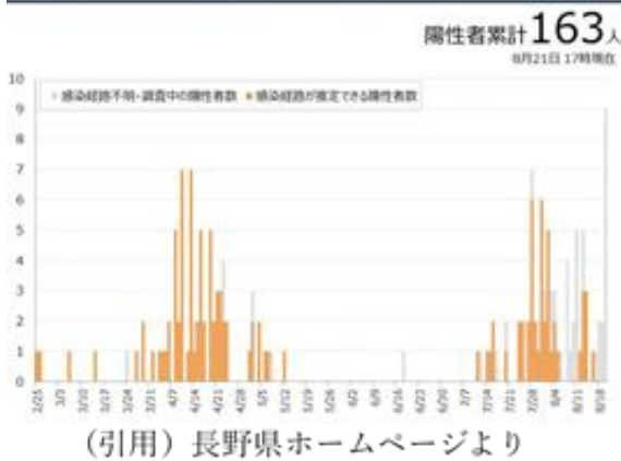
(引用) 長野県ホームページより

第二波は、第一波のときよりも地 方への拡がりが大きく、七月二十六 日、ついに須坂市でも感染者が確認 されました。須坂市の感染事例では 「濃厚接触者が無かった」とのこと であり、それ以後の感染拡大は無か った訳ですが、八月二十一日には、 県内でこれまでで一日最多の九人の 感染者が確認され、感染者数の累計 も百六十三人となり、県内だからと いって決して油断できない状況とな っています。 七月号にも掲載しましたが、自身 の感染および周囲への感染拡大を防 ぐためには、「新しい生活様式」を意 識した行動が必要です。一方で、一 時の感情に惑わされない冷静な行動 も必要です。感染者や濃厚接触者を 特定する行動や、それらの方への差 別・偏見・誹謗中傷を行うことの無 いようにしましょう。