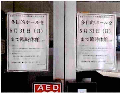
日野地域公民館多目的ホール入口に貼られた臨時休館のお知らせ

なりましたが、再び感染が拡大することを防ぐため、すぐに通常の活動を再開するという訳にはいきませんが、政府が提唱する「新しい生活様式」にも「3密(密閉・密集・密接)の回避」や「人との接触機会の低減」などが謳われており、各種行事の開催にあたっては、個々に必要性や開催方法を検討していく必要があります。区民の皆様にはご理解とご協力をお願いいたします。