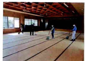
5月の公会堂清掃の様子

ます。公会堂は区民の貴重な共有財産です。使用する際は大切に使用していただくとともに、当番月の際は、ご都合の付く限りご参加いただきますようお願いいたします。