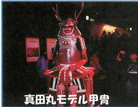
真田丸モデル甲冑