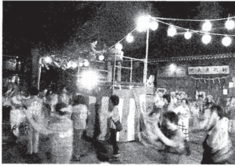
盆踊りの様子。子供たちも楽しんでいる様子。

火抽選会の提供も行いました。育成会の皆さん有難うございました。サプライズの意味も込めまして、小さなお子さんも、より楽しんで頂ける様に休憩時間中に妖怪ウォッチの曲をかけるさせて頂きました。